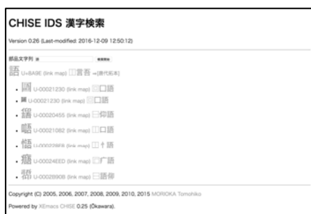
図2 CHISE/ids-find の PC 画面

CHISE は漢字符号をコード制限なしの環境で処理するためのプロジェクトである。CHISE IDS はそのサブプロジェクトとして、漢字の IDS 情報を整備している。IDS-FIND はそれらの IDS 情報を検索するためのウェブアプリである。