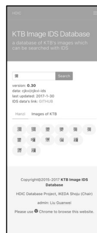
図5 携帯端末での画面