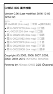
図3 CHISE/ids-find のスマートフォン画面

図2に示すように、CHISE の IDS-FIND 機能は PC 向けで開発されている。図3に示すように、PC 以外の端末でアクセスすると画面の表示が PC とほとんど変わらず、携帯端末によつて操作が難しい場合が生じる。