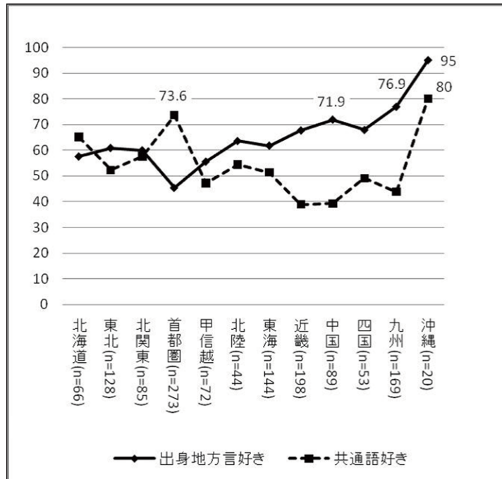
図1 出身地方言と共通語、「好き」の割合

と再カテゴリ化したものを用いている。なお、[問4]の出身地の方言を使うことについての質問は、「(A) 家族」「(B) 同じ出身地の友人」「(C) 異なる出身地の友人」のように親密な間柄の相手とのやりとりに限定したものになっている。このような私的場面においては方言使用に傾くことが先行研究から明かとなっており、その意味で、この調査における方言使用に関する設問は、あらかじめ方言が使用されやすい場面に焦点を絞ったものと言うことができる。