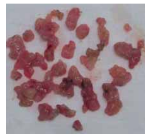
Рис. 5. Объем перкутанно удаленной опухоли лоханки

По жесткой струне свищ бужирован до 28 Шр, установлен кожух Amplatz. При нефроскопии визуализируется опухоль в зоне пиелoureтерального сегмента на широком основании (рис. 4). Осуществлены электрорезекция стенки лоханки с опухолью в пределах здоровых тканей и коагуляция кровотока сосудов. Антеградно установлен стент 7 Шр. Нефроскоп извлечен, установлен нефростомический дренаж. Объем резецированной опухолевой ткани представлен на рис. 5. Послеоперационных осложнений не было. Перед выпиской пациенту выполнена антеградная пиелография: проходимость ВМП удовлетворительная, затеков контрастного вещества нет (рис. 6). Больной выписан на амбулаторное лечение. В стационаре по месту жительства проведен курс иммунотерапии вакциной БЦЖ, которая вводилась в мочевой пузырь и путем рефлюкса попадала в лоханку. После лечения стент извлечен. При контрольном обследовании, проведенном через 8 мес, данных, подтверждающих наличие рецидива опухоли, не зарегистрировано.