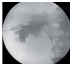
Рис. 3. Антеградная пиелограмма слева. Видны ретроградно установленный мочеточниковый катетер и дефект наполнения в области пиелoureтерального сегмента