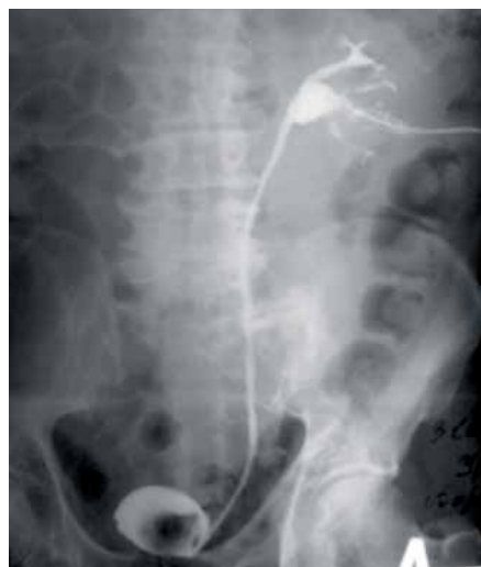
Рис. 6. Антеградная пиелoureтерограмма слева после перкутанной электрорезекции опухоли лоханки

Всем больным проводили БЦЖ-терапию. У 3 пациентов вакцину вводили по нефростомическому дренажу, а у последнего — ретроградно путем рефлюкса по стенту. За время наблюдения (8–26 мес) развития рецидива опухоли не зафиксировано.