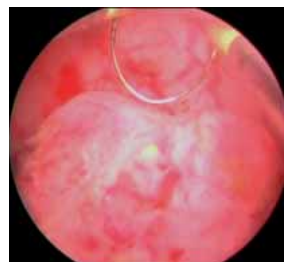
Рис. 4. Интраоперационное фото. Опухоль лоханки левой почки