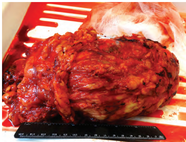
Рис. 2. Вид удаленной почки с опухолью и прилежащей клетчаткой

(бугристыми) контурами. Максимальные размеры образования — 18,6 × 11,3 × 11,8 см (вертикальный × поперечный × сагиттальный). Структура неоднородная, с множественными гиподенсными участками неправильной формы без четких контуров с тенденцией к слиянию (вероятно, зоны некроза) и немногочисленными мелкими кальцинатами. Кортиковое и мозговое вещество не дифференцируется. Образование сильно васкуляризовано сетью артериальных сосудов мелкого калибра. Отмечается неравномерное накопление контрастного