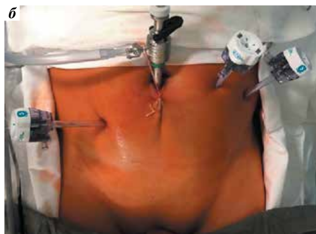
Схематичное (а) и интраоперационное (б) расположение портов при выполнении видеоэндоскопической внебрюшинной простатэктомии Schematic (a) and intraoperative (b) location of the ports during videoendoscopic extraperitoneal prostatectomy