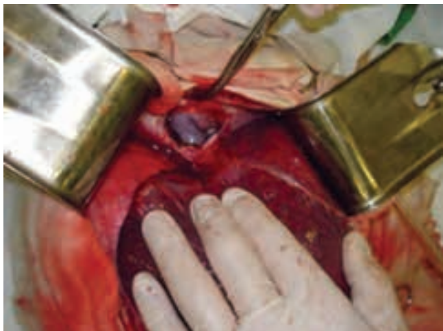
Рис. 2. Пациент Б., 2 лет. Этап диафрагмоперикардиотомии для наложения турникета на интраперикардальный сегмент НПВ