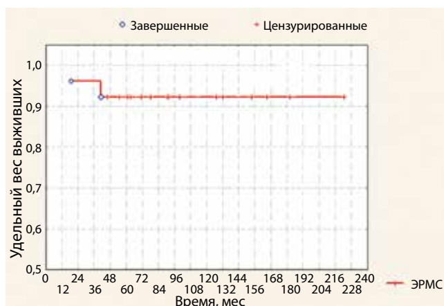
Рис. 4. Общая выживаемость

кальные вмешательства – ревизия с биопсией, операция Винкельмана или Бергмана, удаление опухоли.