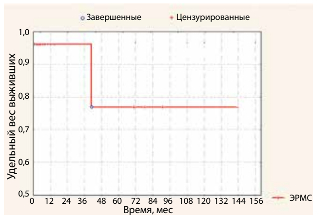
Рис. 3. Безрецидивная выживаемость