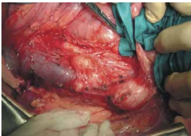
Рис. 2. Забрюшинная лимфодиссекция

Лечение ЭРМС яичка, как уже говорилось выше, было комбинированным, проведенным всем 26 (100 %) детям с ЭРМС. «Золотым стандартом» лечения злокачественных паратестикулярных опухолей, к которым относится ЭРМС, остается ОФЭ из пахового доступа. ОФЭ выполнена у всех 26 (100 %) детей с ЭРМС. К сожалению, не все дети поступили к нам с первичной опухолью, зачастую по месту жительства ошибочно выполняли нерадикальное оперативное вмешательство, что приводило к рецидивированию и к выполнению повторной операции. Только 9 (34,6 %) детей были оперированы радикально по месту жительства, еще 9 (34,6 %) детям выполнили неради-