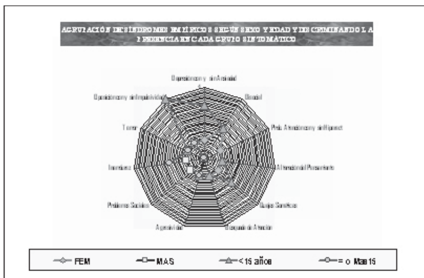
Gráfico 2: Agrupación sindrómica por edad y sexo según presencia de los grupos sintomáticos

este estudio; con el Objetivo General de obtener una estructura taxonómica explicativa de la psicopatología en una población adolescente, abordada con los instrumentos del sistema, posibilitando un estudio comparativo, con los hallazgos de Achenbach et al (1991) y López Soler et al (1998).