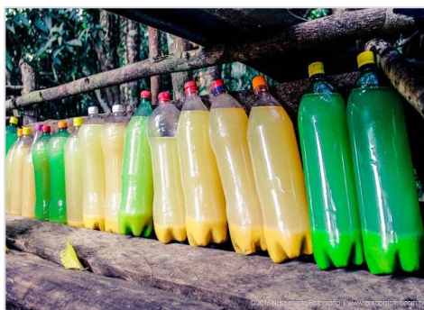
Figura 02: Fermentação da maniueira, registrada na comunidade do Tracajatuba, na zona rural de Macapá-AP

Muitos dos alunos disseram não saber do que eram produzidas essas iguarias (tacacá, tucupi e maniçoba) mesmo já tendo consumido várias vezes. Na exposição do vídeo, os alunos puderam observar como acontecia o processo artesanal e um pouco da realidade dos produtores. Nesse contexto, foram mencionados os produtores de farinha locais e as diferenciações do processo artesanal ao processo industrial. Esse momento da oficina destaca a valorização do conhecimento popular. É de muita importância que se faça uso de novas metodologias que despertem a curiosidade do aluno. Pois nossa cultura amapaense é rica de saberes, e se faz importante que esses conhecimentos não sejam esquecidos (CHASSOT, 2008). A Figura 2 traz um registro do momento da decantação do tucupi e da goma, feito por pequenos produtores do interior do estado do Amapá.