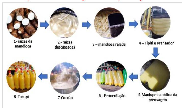
Figura 01: Etapas a serem seguidas na produção do Tucupi

Procurou-se estabelecer uma familiarização das técnicas de produção do tucupi com os alunos, apresentando a eles as etapas da produção artesanal do tucupi, incluindo imagens de todos os processos. As etapas estão apresentadas na Figura 1.