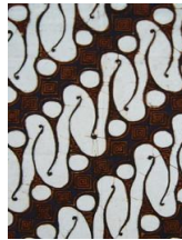
Gambar 1. Batik Parang Rusak/Barong

Motif batik tradisional Parang Rusak diciptakan oleh Sultan Agung kerajaan Mataram. Motif ini mengandung perlambang yang agung, sehingga jaman dahulu yang berhak menggunakan motif ini hanyalah para bangsawan tinggi dan tidak digunakan setiap hari. Namun pada saat upacara-upacara kenegaraan [3]. Makna dari motif Parang Rusak yaitu agar manusia di dalam hidupnya dapat mengendalikan nafsunya, sehingga memiliki watak dan perilaku yang luhur.