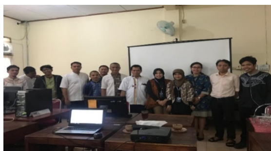
Gambar 9. Dokumentasi saat acara penutupan oleh tim pelaksana dan peserta PKM Guru SMP PATTIMURA Jagakarsa, Jakarta Selatan

Sehingga, siswa mengalami kebingungan dikarenakan ada beberapa tahapan yang terlewat ketika mereka tidak masuk. Ini menyebabkan siswa tidak sepenuhnya mendapatkan pembelajaran kemampuan permulaan membaca melalui perlakuan phonic method .