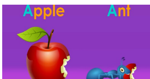
Gambar 7. Contoh Huruf Fonem dalam Phonics Method

Berdasarkan hasil yang ditunjukkan, penggunaan phonic method mampu memberikan pengaruh terhadap adanya peningkatan kemampuan membaca. Terbukti ketika siswa mampu membaca suku kata berpola vokal konsonan dan konsonan vokal, serta mampu membaca kata dengan lebih lancar. Namun, satu orang siswa mengalami penurunan kemampuan membaca permulaan. Siswa menjadi kurang percaya diri dan masih bingung ketika diminta untuk membaca suku kata, khususnya yang berpola vokal konsonan dan membaca kata utuh.