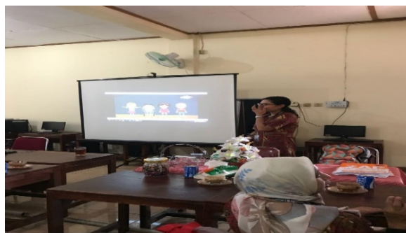
Gambar 3. Dokumentasi saat tim pelaksana memutar video pelafalan bunyi & huruf dalam Phonics Method

Hasil wawancara yang telah dilakukan dengan guru setelah perlakuan menggunakan phonics method menunjukkan bahwa anak menjadi lebih memahami tentang huruf-huruf dan lebih mudah mengaitkan hubungan bunyi dengan katanya. Phonics method memudahkan anak membuat hubungan otomatis antara kata & bunyi, anak dapat membunyikan dan membacanya sendiri. Pada saat treatment berlangsung, anak mampu mengaitkan antara bunyi huruf yang satu dengan yang lain sehingga mampu membentuk sebuah suku kata dan kata. Penggunaan phonics method dapat menjadikan sebagian anak yang sukar membaca menjadi lebih fasih membaca. Salah satu metode untuk anak yang lebih besar (sudah mengenal huruf) yang merasakan sukar membaca.