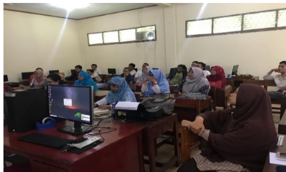
Gambar 5. Dokumentasi suasana pelatihan PKM Guru di SMP PATTIMURA Jagakarsa Jakarta Selatan

Salah satu metode pembelajaran membaca yang saat ini diterapkan di SMP PATTIMURA yaitu dengan metode komunikatif dan metode ceramah. Dalam penerapan metode tersebut, siswa-siswi mengikuti perintah dari guru dengan mengerjakan tugas di lembar kerja siswa, guru menyuruh siswa menulis dan membaca kata di papan tulis, serta siswa juga rutin diminta untuk membaca melalui buku bacaan siswa. Ketika pembelajaran seperti ini dilakukan berulang-ulang dan menjadi kebiasaan, maka akan menimbulkan tekanan dan kejenuhan karena siswa masih dalam penyesuaian dengan phonics method yang masih awam diserapnya.