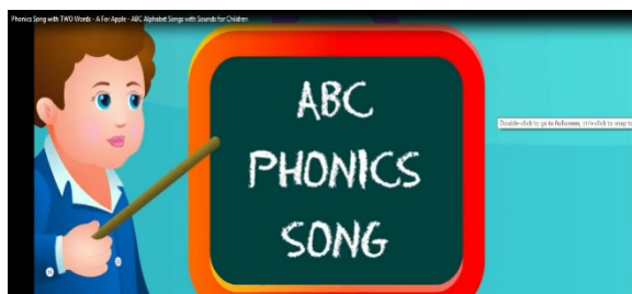
Gambar 6. Video Pelafalan phonic method “ABC Phonics Song”

Berdasarkan hasil yang ditunjukkan, penggunaan phonic method mampu memberikan pengaruh terhadap adanya peningkatan kemampuan membaca. Terbukti ketika siswa mampu membaca suku kata berpola vokal konsonan dan konsonan vokal, serta mampu membaca kata dengan lebih lancar. Namun, satu orang siswa mengalami penurunan kemampuan membaca permulaan. Siswa menjadi kurang percaya diri dan masih bingung ketika diminta untuk membaca suku kata, khususnya yang berpola vokal konsonan dan membaca kata utuh.