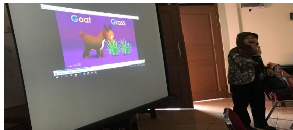
Gambar 2. Dokumentasi saat tim pelaksana menyajikan materi Phonics method

Dalam kegiatan pengabdian masyarakat ini, tim abdimas menggunakan pendekatan shynthetic phonics . Pendekatan tersebut dipilih karena dianggap paling cocok untuk digunakan dalam pengenalan membaca pada siswa, karena pembelajarannya memfokuskan pada synthetic phonics , yaitu kata dipisah menjadi bagian terkecil dari unit yaitu suara (fonem). Siswa-siswi diajari huruf (graphemes) dan merepresentasikan ke dalam fonem dan juga belajar mencampurnya kedalam kata. Oleh karena itu, phonics sintetik sistematis instruksi lebih baik dari instruksi phonics analitik dalam mengembangkan kesadaran fonemik, kata membaca, mengeja dan pemahaman bacaan.