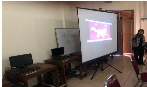
Gambar 4. Dokumentasi saat tim pelaksana melafalkan setiap bunyi & huruf dalam Phonics Method

Penggunaan phonics method terhadap kemampuan membaca permulaan menunjukkan bahwa siswa sangat antusias dalam merespon metode ini, dikarenakan metode ini menggunakan bantuan lagu dan games . “Nyanyian, rima, pembacaan puisi, dan permainan kata merupakan sumber permainan yang menyenangkan dan akan meningkatkan kesadaran siswa mengenai pola bunyi dan perbedaan bunyi pada siswa”. Pada saat penerapan phonics method di kelas, mereka terlihat tertarik dan semangat ketika Ibu Guru memberikan nyanyian tentang bunyi huruf, kartu gambar serta permainan-permainan yang berpengaruh pada peningkatan pemahaman mengenai bunyi-bunyi huruf dan bentuk hurufnya.