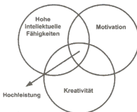
Abbildung 2: Drei-Ringe-Modell der Hochbegabung nach Renzulli

unseren Erfahrungen oftmals mit steigendem Begabungspotenzial, wenn es um die Belegung eines Kurses geht, bei dem ausdrücklich auf Akzeleration und Enrichment hingewiesen wurde.