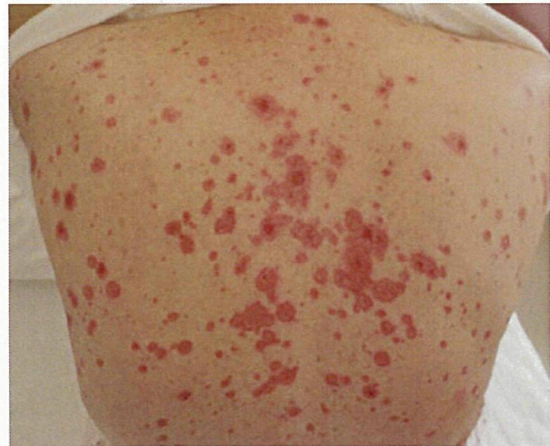
図 3.: 背部の滲出性紅斑

病理検査：皮膚科にて皮膚の迅速病理診断が行われた。表皮角化細胞の融合性壊死像と表皮真皮境界の液状変化を認め(図 4)、重症型滲出性紅斑と診断された。