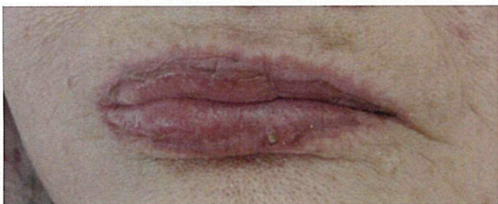
図 1. 口唇のびらん

身体所見：体温 38 度。口唇および口腔内にびらん(図 1)を認めた。両眼に結膜充血・眼脂を認めた(図 2)。背部を中心に多形性紅斑(図 3)および水疱とびらんを認めた。