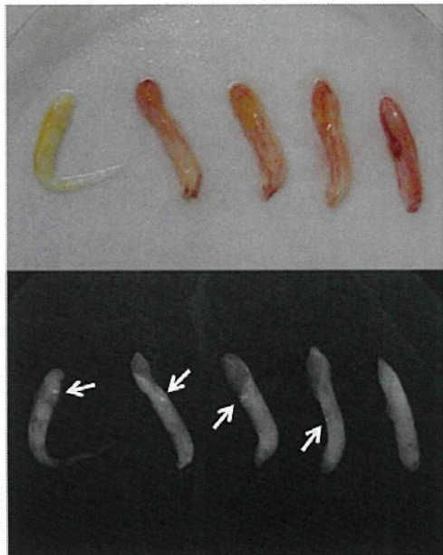
図2 specimen マンモグラフィ (矢印は石灰化)