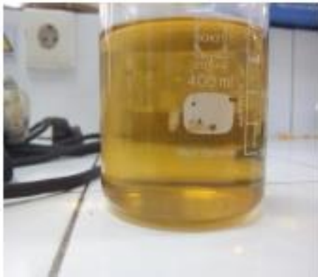
Gambar 1. Kondisi Fisik Crude gliserol