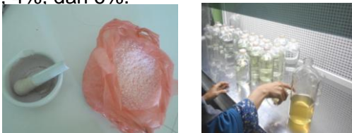
Gambar 1. Pembuatan media urea dan MET

Pupuk urea yang digunakan merupakan pupuk komersil yang berbentuk serbuk. Dosis pupuk urea yang digunakan adalah 80 ppm, 100 ppm, dan 120 ppm dikombinasikan dengan MET 2%, 4%, dan 6%.