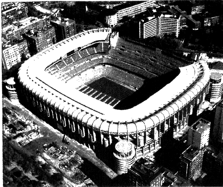
Fig. 2.- Aplicación del GRC. Estadio Santiago Bernabeu, Madrid.

Figure 2 shows an exact of application of GRC as a wall panel. Santiago Bernabeu Stadium, Madrid.