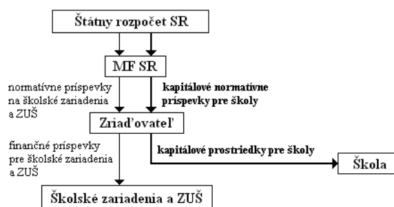
Schéma č. 1. – Schemat nr 1