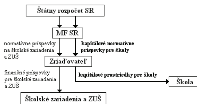
Schemat nr 1:

Cały proces uzyskiwania wymienionego dochodu dla przedszkola przebiega w następujący sposób: rodzice, krewni albo inne podmioty, które chcą darować 2% ze swojego podatku dla przedszkola, realizują tę operację przy pomocy ankiety, która jest załącznikiem do zeznania podatkowego składanego w poszczególnych urzędach skarbowych. Urzędy natomiast przekazują tę kwotę na konto bankowe stowarzyszenia. Takie dochody mogą być wykorzystane tylko na cele przewidziane w ustawie, które dotyczą działalności przedszkola.