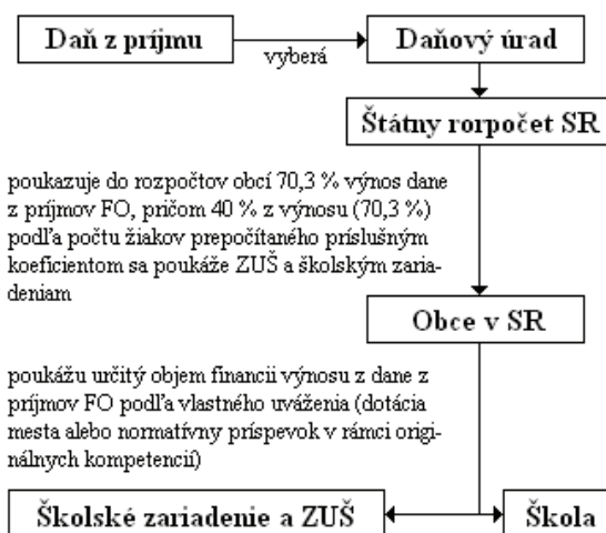
Schemat nr 2:

Z doświadczenia wiemy, że większość przedszkoli otrzymuje znacznie mniej pieniędzy niż powinny dostać według ustalonych współczynników. Ze składek miesięcznych rodziców opłaca się: energię, środki higieniczne i materiały niezbędne do funkcjonowania przedszkola. Nie ma funduszy na opłacenie asystenta nauczyciela, logopedy. Finansowanie w „podmiocie prawa” szkoły podstawowej z przedszkolem jest inne. Szkoła podstawowa jest finansowana zgodnie z ustawą z budżetu państwa, przedszkole zaś – przez gminę.