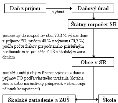
Schéma č. 2 – Schemat nr 2

Finančné príspevky pre školské zariadenia a ZUŠ – składki finansowe dla placówek szkolnych i Podstawowych szkół artystycznych Kapitałové normatívne príspevky pre školy – kapitałowe dotacje normowe dla szkół Kapitałové prostriedky pre školy – środki kapitałowe dla szkół