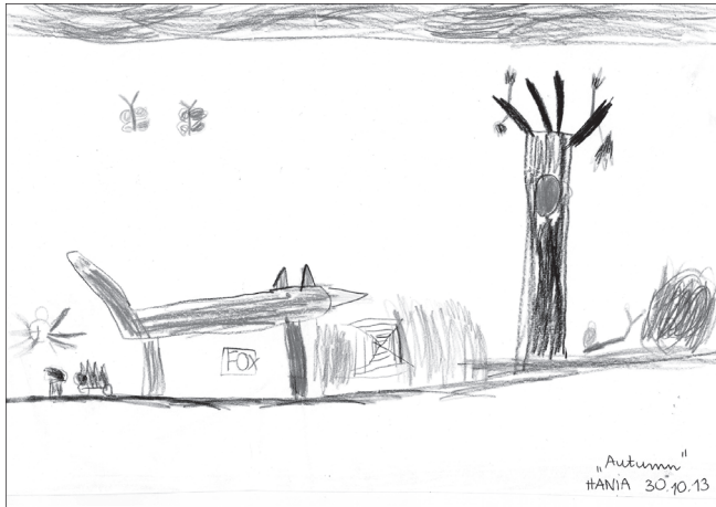
Rys.3. Hania, 5 lat