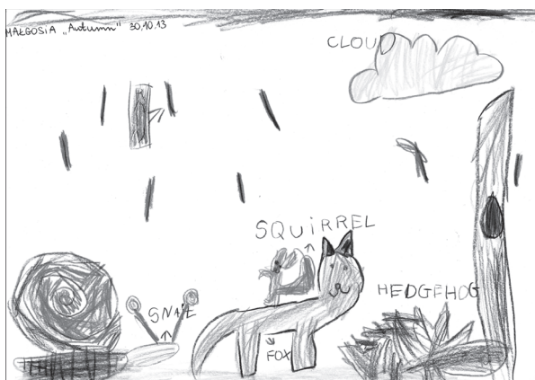
Rys. 1. Małgosia, 6 lat

Nauczyciel wyjaśnia dzieciom, że będą teraz rysować jesień oraz poznane zwierzęta na swoich kartkach. Starsze dzieci wykonują rysunek samodzielnie. Niektóre dzieci podpisują przedstawione na rysunku przedmioty. Nauczyciel pisze na osobnej kartce potrzebne wyrazy, dzieci przepisują. Młodsze odbijają kształt zwierząt przy pomocy foremek, a następnie kolorują. Poniżej załączam niektóre prace dzieci 5- i 6-letnich.