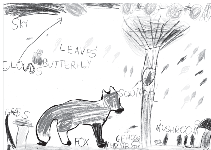
Rys. 4. Emilka, 6 lat