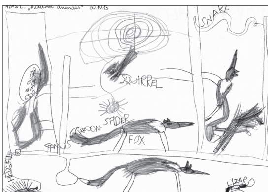
Rys. 5. Adaś, 6 lat