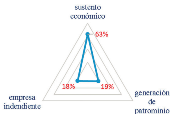
Figura 3: Motivantes para la continuidad empresarial Fuente: Encuesta aplicada a la empresa familiar Elaborado: Por los autores

las empresas que mezclan la propiedad y gestión de la empresa con los roles dentro de la familia. De los conflictos que llegan a instancias legales se observa que los acuerdos no favorecen a todos los involucrados equitativamente y rompe las relaciones familiares, por ello, se debe buscar estructuras legales que favorezcan a la propiedad de la familia.