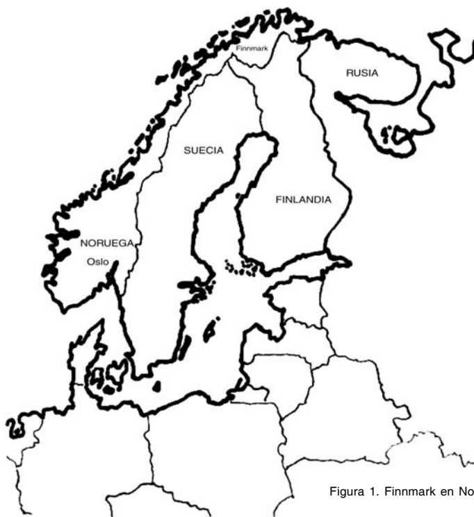
Figura 1. Finnmark en Noruega.