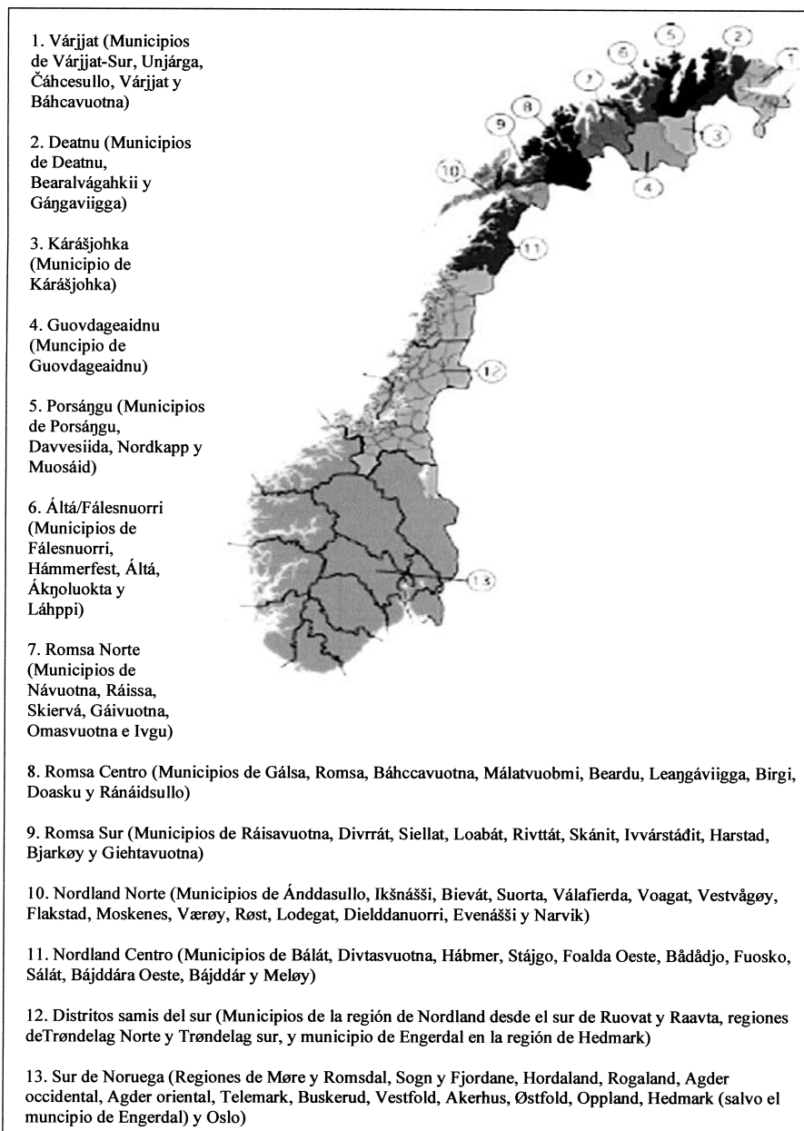
Figura 5. División administrativa de los distritos electorales para el Parlamento Sami de Noruega. Adaptado de la página del Parlamento Sami de Noruega ( http://www.samediggi.no/artikkel.asp?MId=1&AId=259&back=1 )