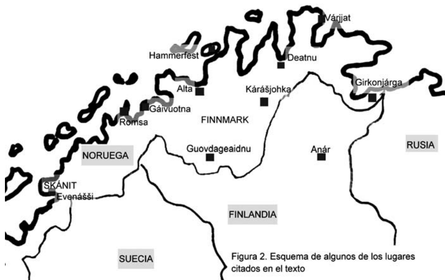
Figura 2. Esquema de algunos de los lugares citados en el texto