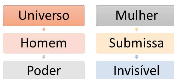
Figura 1 - Representatividade da mulher e do homem na sociedade

Fonte: Autor (adaptado de BUTLER, 2015, p. 31)