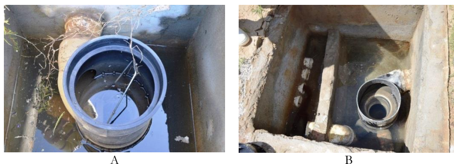
Figura 5. Vista dos filtros instalados a montante dos reservatórios no campus de Currais Novos.

específicas para a desinfecção de água para consumo humano. Durante as inspeções dos sistemas nas visitas in loco foi observado que os dispositivos de proteção sanitária a montante dos reservatórios já estavam há muito tempo sem manutenção, contendo muita vegetação e areia dentro das caixas de passagem e, em alguns dos filtros as telas não haviam sido instaladas (Figura 5).