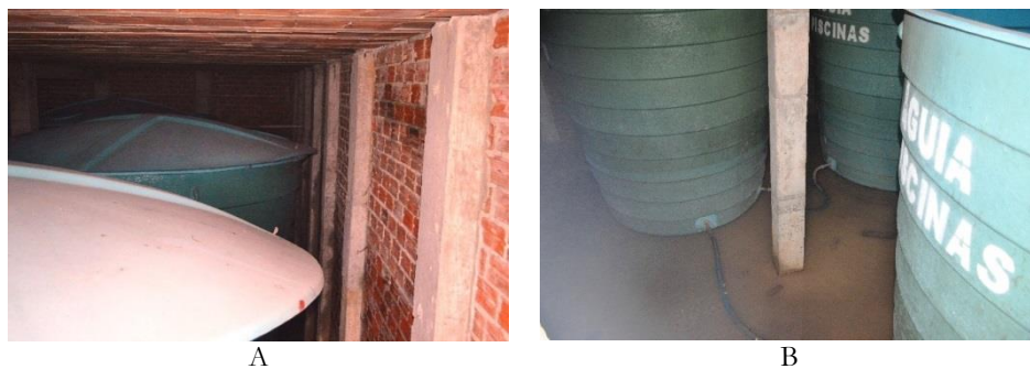
Figura 1. Vista dos reservatórios de água de chuva no campus de Canguaretama (A – prédio principal; B – prédio anexo).

Figura 2 mostra a boa infraestrutura reservada ao sistema de armazenamento de água de chuva, inclusive com extravasor e vasos comunicantes.