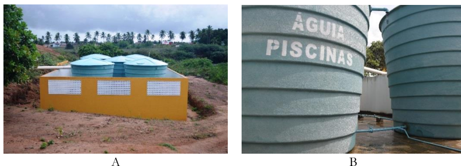
Figura 2. Vista dos reservatórios de água de chuva no campus de Ceará-Mirim (A – vista geral; B – detalhe do extravasor e vasos comunicantes).