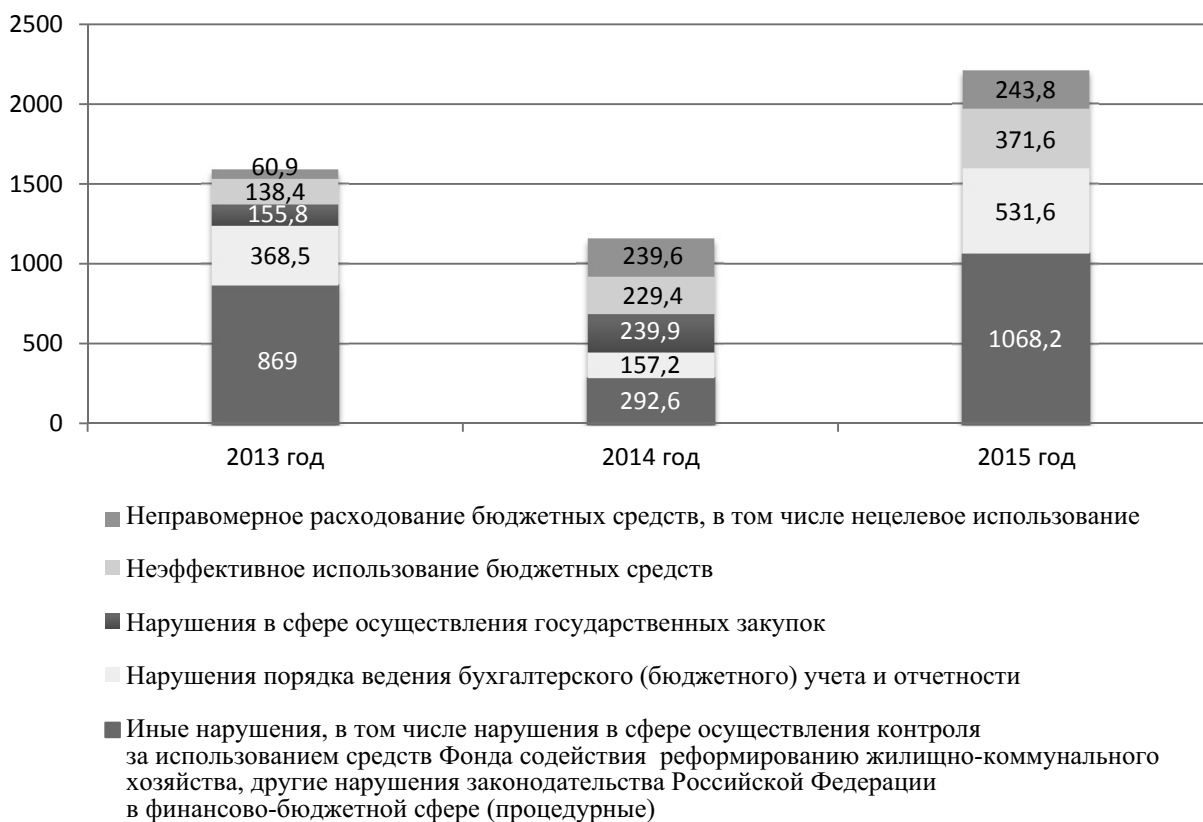
Рис. 2. Динамика результатов деятельности органа внутреннего госфинконтроля за 2013–2015 гг.

Однако предлагается достаточно абстрагированный подход к расчету вероятностных показателей модели, что значительно снижает ее точность.