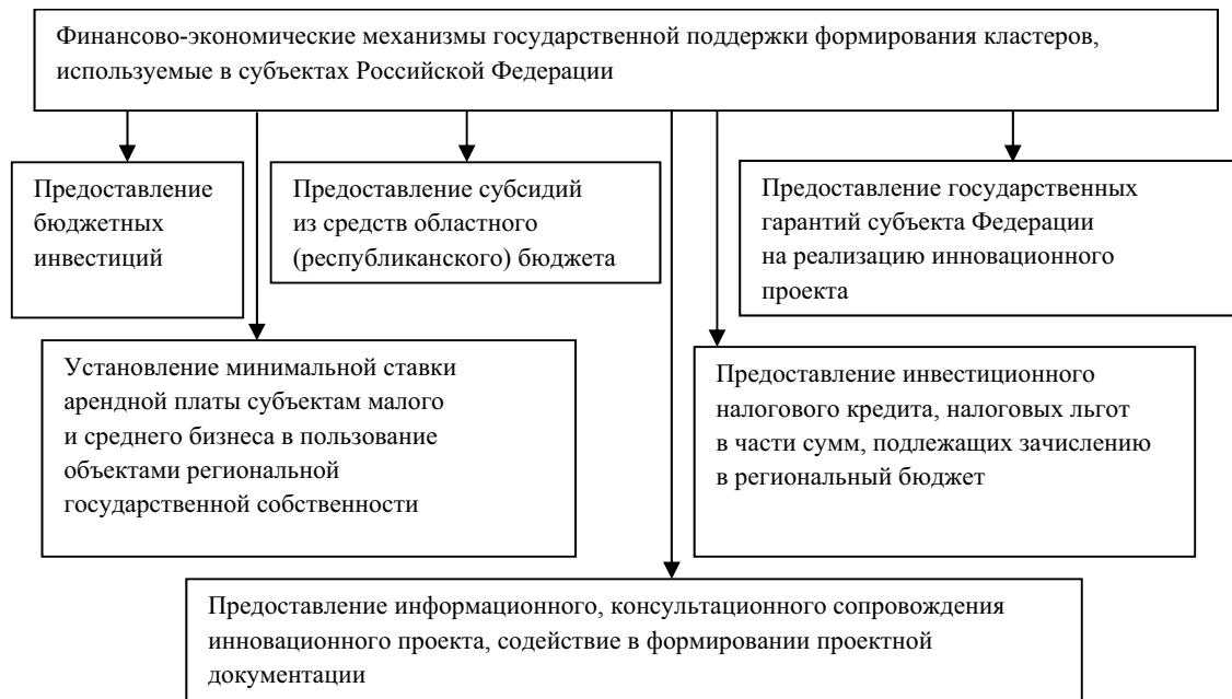
Рис. 4. Финансово-экономические механизмы, используемые в субъектах Российской Федерации при формировании инновационных территориальных кластеров