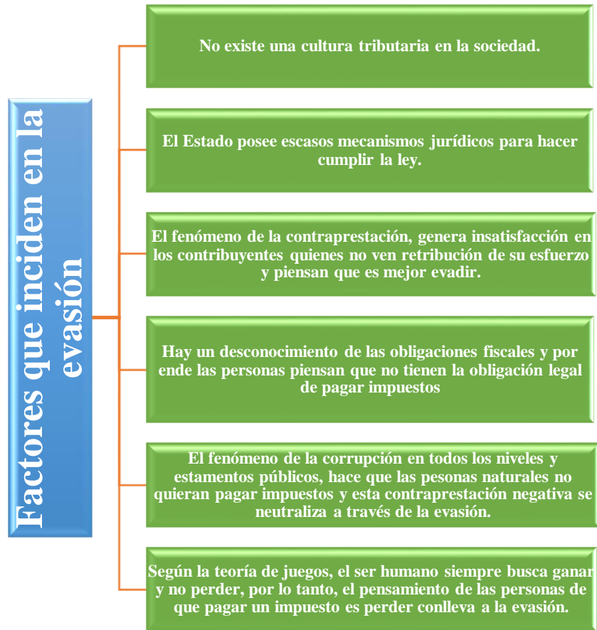
Figura 1. Factores que inciden en la evasión.