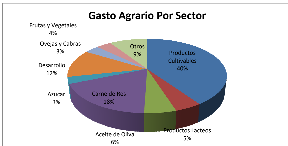
Ilustración 2. Gasto Agrario por sectores