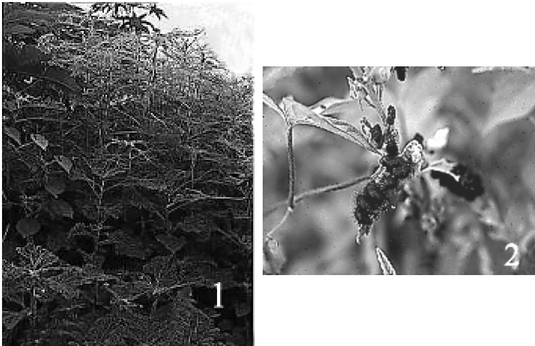
Figuras 1 y 2

Verbenaceae entre las más importantes (Arnett 1968, Anaya 1987). Una de las especies de esta subfamilia de importancia económica es la "catarinita de la papa" ( Leptinotarsa decemlineata Say) que es la principal plaga de este cultivo en algunas partes del mundo (Gimingham 1950, Gauthier et al. 1981, Bartlett & Murray 1986, Casagrande 1982).