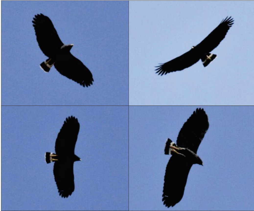
Figura 2. Registro de Buteogallus solitarius en El Limoncito, Municipio de Santa María Tonameca, Oaxaca.

apreciar la banda blanca transversal en la parte media de la cola, así como las puntas blancas de la cola que son distintivos de la especie durante el vuelo (Íñigo-Elias, 2000). Fue posible apreciar que el ejemplar no tenía marcas (barras) en las plumas de los muslos como B. urubitinga y las alas no se juntaban con la cola como ocurre en B. anthracinus lo que permitió discriminar la identificación con respecto a estas especies mediante el uso de las guías de Howell & Webb (1995) y Van Perlo (2006).