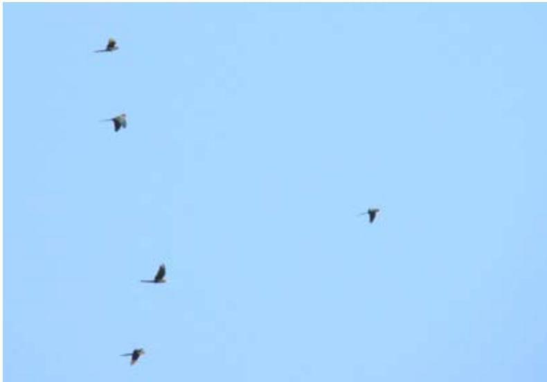
Figura 2. Registros fotográficos de guacamaya verde en Papalutla, Guerrero, 23 de diciembre de 2010.

Debido a la conducta y los horarios de arribo y salida de las guacamayas al cañón, es probable que los individuos estén utilizando el sitio como un dormidero (Forshaw