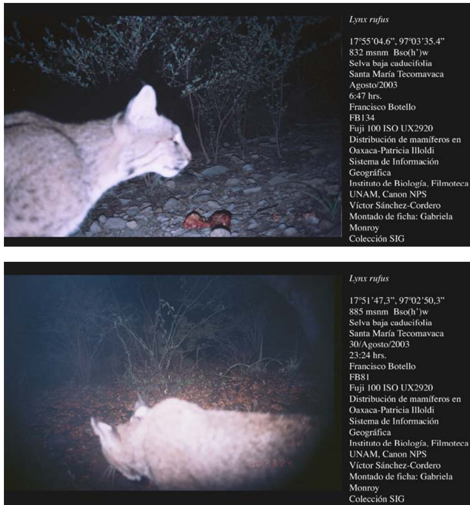
Figura 3 Fotocolectas de gato montés ( Lynx rufus ). El formato de fotocolecta es según Botello (2004).

las 23:23 y 23:24 hrs, respectivamente; en el segundo sitio, se tomó una fotografía a las 6:47 hrs (Fig. 3). La distancia entre ambos sitios es de 6.3 km en línea recta.