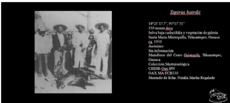
Figura 1. Fotocolecta de tapir centroamericano Tapirus bairdii en el Istmo de Tehuantepec, Oaxaca, México (ca. 1950).

El registro obtenido se encuentra a 40.4 km al suroeste del registro histórico más cercano en La Ventosa (March 1994). La procedencia del ejemplar probablemente corresponde, al igual que otros registros históricos, a alguna población que pudo haber existido en la Planicie costera del Istmo de Tehuantepec (Lira et al. 2006) o posiblemente se trata de animales cuyo origen es la región de Los Chimalapas y que se desplazaron a esta zona por la persecución de cazadores o incendios (Delfin-Alfonso et al. 2008), o quizá se trate de animales que se desplazan a nuevas áreas en