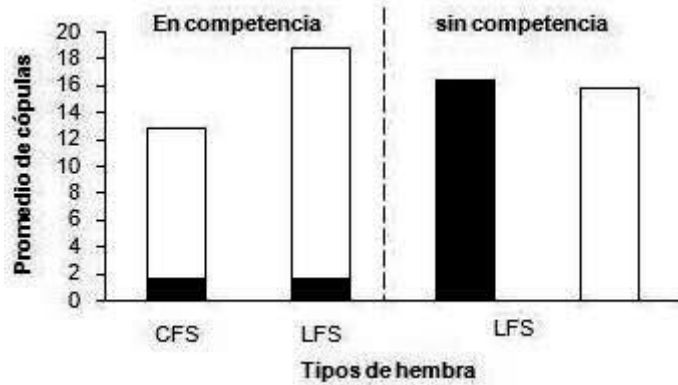
Figura 2. Promedio de apareamientos registrados en competencia y sin competencia de A. ludens , las barras blancas representan a machos LFS y las barras negras a los LFM.

referencia el estándar interno que fue inyectado a una concentración de 100 ng/μl en ambas muestras, no se observaron diferencias significativas en la cantidad emitida de volátiles (Z-3 nonenol U=46, P>0.05; Z,Z-3,6 nonadienol U=30, P>0.05; suspensolide U=44, P>0.05; E,E- farneseno Z=48, P>0.05; anastrefina U=46, P>0.05; epianastrefina U=41, P>0.05).