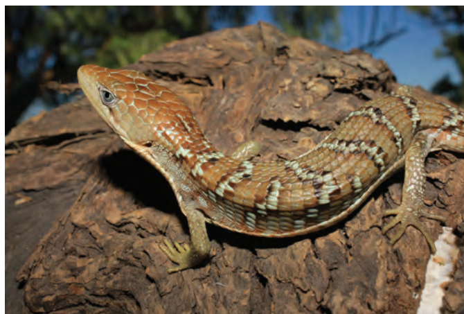
Figura 1. Gerrhonotus infernalis (ENCB-18788) colectado en Mineral de Pozos Guanajuato.

Además del ejemplar ENCB 18788, fueron encontrados mediante la búsqueda en bases de datos otros dos registros (MNHN-5140; KU-33587) procedentes de la Sierra Gorda de Guanajuato, pertenecientes a la localidad de El Río Álamos Cañón Mulato, Las Margaritas; de los