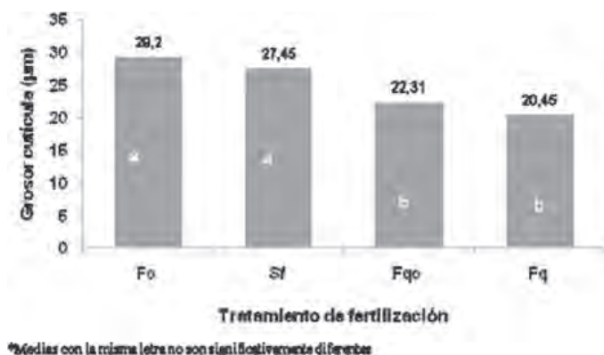
Figura 2. Grosor de cutícula ( \mu\text{m} ) de cladodios producidos en diferentes modalidades de fertilización.

varon entre 17.5 y 56.8 cristales en quince variedades de nopal.