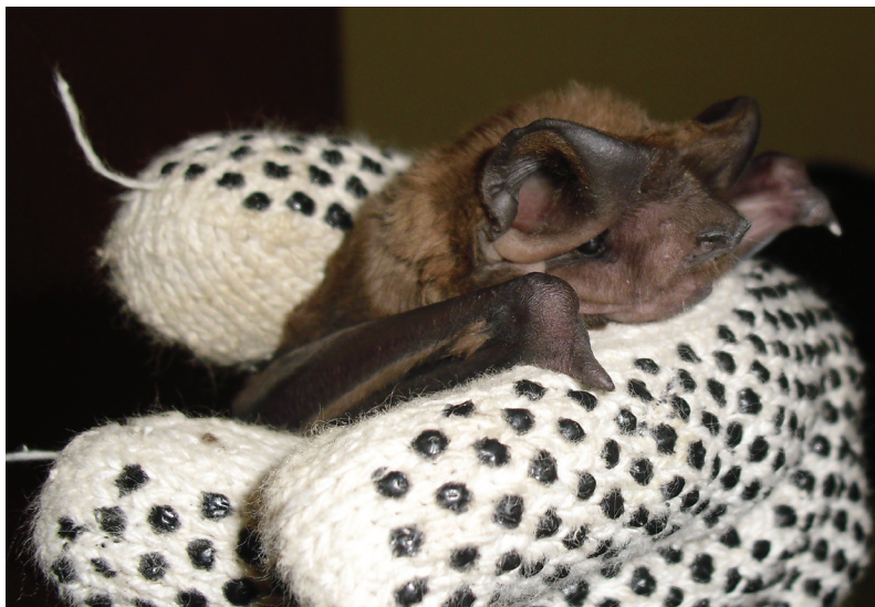
Figura 1. Ejemplar de Eumops glaucinus colectado en la Iglesia San Antonio (Lules, Tucumán).

dichas especies se puede explicar por diferentes causas, como pueden ser el tiempo y el tipo de muestreo. Las redes de niebla son un método efectivo para especies de la familia Phyllostomidae, que forrajean principalmente en el sotobosque, no así para la mayoría de las familias de murciélagos (Molossidae, Vespertilionidae) cuyo tipo de alimentación y mejor sistema de ecolocación influyen en el tipo de vuelo (maniobrabilidad, altura), y probabilidad de captura. Es por ello que en este estudio la mayor dificultad fue la colecta en las áreas arboladas, donde los murciélagos vuelan a una altura elevada como para capturarlos con redes de neblina. A partir de la experiencia de este trabajo se sugiere la combinación de diferentes métodos, como los monitoreos acústicos (ver Siles 2005) para lograr un muestreo más representativo de la riqueza de especies dentro de un ambiente urbano.