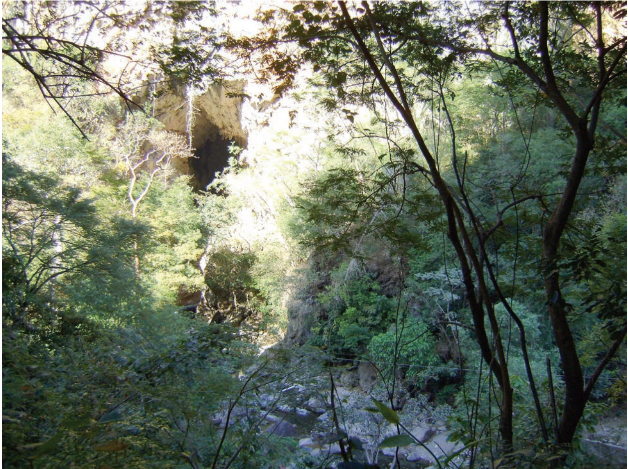
Figura 3. Hábitat característico de los especímenes estudiados en la localidad de Acahuizotla (Guerrero, México).