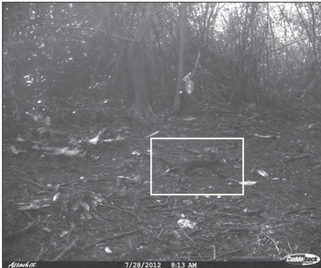
Figura 2. Fotografía de comadreja ( Mustela frenata ) obtenida por medio de una trampa cámara en la región centro-oeste del estado de Campeche, México.

Las fotografías confirman por primera vez la presencia de la comadreja en Campeche, la cual había sido considerada como posible (Guzmán-Soriano et al. 2013b, Vargas-Contreras et al. 2014) pero sin existir confirmación (Guzmán-Soriano et al. 2013a, Sosa-Escalante et al. 2013). La falta de observaciones previas de comadrejas