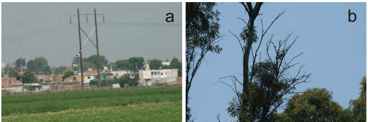
Figura 4. (a) Elanus leucurus , individuo adulto forrajeando en un polígono de cultivos extensos de alfalfa y pastizal. San Gregorio Atzompa, 26 de abril de 2015. (b) Nido de Elanus leucurus con dos volantones a 7 m de altura sobre eucalipto, Eucalyptus sp., de 11 m. San Gregorio Atzompa, 26 de abril de 2015.

población de esta especie está experimentando una expansión en su rango de distribución, tal como se ha observado en otras regiones agrícolas (Hawbecker 1940; Eisenmann 1971; Rodríguez-Estrella et al. , 1995).