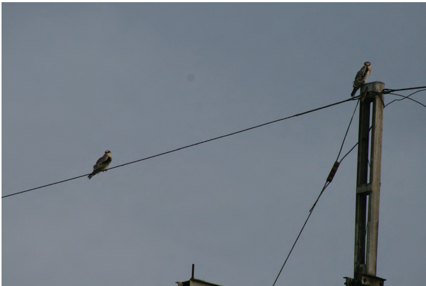
Figura 1. Elanus leucurus , dos juveniles perchados sobre cable y poste de electricidad. San Andrés Cholula, 20 de agosto de 2008.