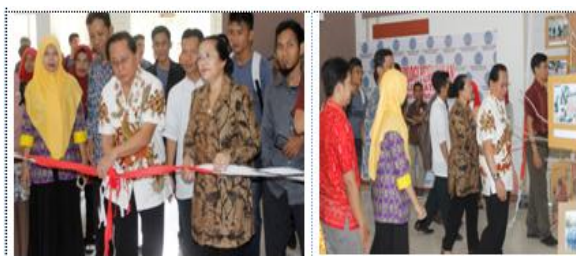
Gambar 3. Pemotongan Pita oleh Rektor IKIP Mataram pada Pembukaan Pameran Fotografi