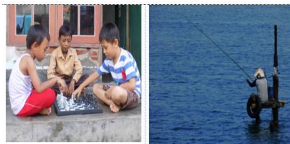
Gambar 2. Contoh Hasil Karya Fotografi Mahasiswa

dengan diberi bingkai memanfaatkan karton/kardus bekas yang digunting dengan ukuran yang sama yaitu 40 x 50 cm. berikut contoh beberapa foto yang lulus seleksi.