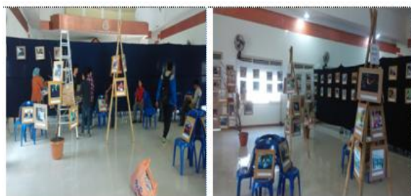
Gambar 2. Persiapan Ruang Pameran Fotografi

dipamerkan ditempatkan di rentangan kain yang ditata dapat ditempel foto, di ranting-ranting kayu yang telah dimodifikasi, dan di kursi-kursi yang ditata menarik oleh panitia. Penataan yang bervariasi tersebut dilakukan agar penempatan foto tidak monoton dan terlihat lebih unik serta menarik; 4) Poster, Brosur, dan Spanduk dimana Poster dan brosur pelaksanaan pameran fotografi digunakan sebagai sarana publikasi agar banyak orang yang mengetahui tentang kegiatan pameran tersebut. Poster dan brosur disebar di lingkungan IKIP Mataram, sekolah-sekolah SMA se-Kota Mataram, media cetak dan elektronik di kota Mataram, serta perguruan tinggi yang ada di Kota Mataram. Spanduk diperlukan sebagai sarana publikasi kegiatan pelaksanaan pameran fotografi yang berfungsi sebagai informasi bagi khalayak umum se-Kota Mataram. Spanduk kegiatan dipasang ditempat-tempat yang dianggap strategis yang telah disediakan oleh Pemerintah Kota Mataram melalui izin publikasi dari Dinas Pertamanan Kota Mataram, terpasang selama 2 minggu.