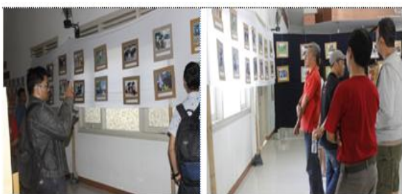
Gambar 4. Pengunjung Pameran Fotografi

Berdasarkan hasil studi dokumen terhadap daftar hadir peserta pameran, diketahui bahwa pengunjung pameran pada hari pertama yaitu tanggal 29 Juli 2016 sebanyak 58 pengunjung yang berasal dari mahasiswa, dosen, siswa siswi dari Kota Mataram, Federasi Seni NTB, dan alumni IKIP Mataram. Sementara hari ke dua, tanggal 30 Juli 2016 pengunjung berjumlah 32 orang yang berasal dari mahasiswa, dosen, siswa-siswi SMA dan SMK sekitar Kota Mataram, dan alumni IKIP Mataram. Berikut adalah gambar pengunjung pameran fotografi.