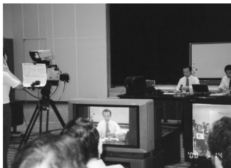
図2 センター側の実験風景

した(図1)。前述のように、今回の実験では、衛星通信による言語教育の潜在的な活用法の一つとして、視覚的・聴覚的手段に着目し、遠隔日本語教育において何が使え何が使えないかを確認することも意図したためである。更に、解答後の情報提供で使用する写真や実物を準備した。