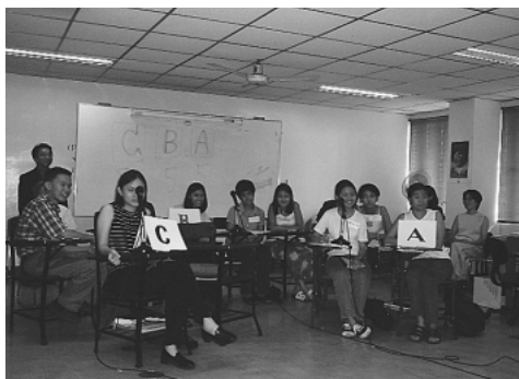
図3 マニラ側の実験風景

ンケートでは今回の授業を評価し、「これからもやりたい」「もっと話したい」という積極的な意見が強かった。音声や画像についての問題も、学生自身は特に感じなかったようである。内容に関する回答結果については、次ページ表3のようにまとめられる。