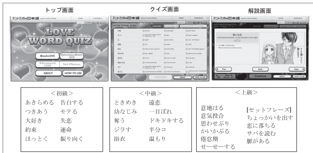
図4 「LOVE WORD QUIZ」

頻度順にレベル分けしたジャンル用語を初級200、中級500、上級1000のレベル別に3択クイズで学習できる。意味や品詞を示すだけではなく、アニメ・マンガ中での使われ方として用語を使ったセリフ入りのマンガコマ画解説もある。上級レベルでは「ヤキモチを焼く」などのセットフレーズ (慣用句) にも挑戦できる。各ジャンル1000の用語 (上級レベルの80~100のセットフレーズを含む) を取り上げている。