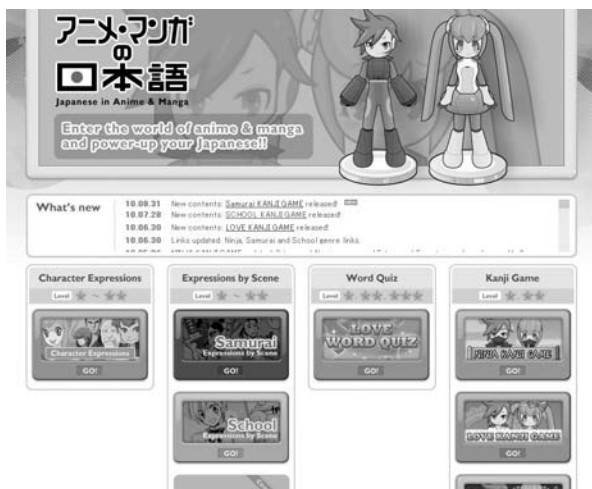
図1 「アニメ・マンガの日本語」 Web サイト、トップ画面