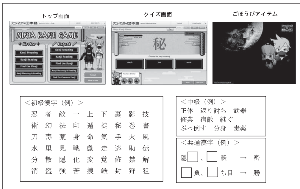
図5 「NINJA KANJI GAME」

ジャンルによく現れる漢字を初級、中級のレベル別に時間制限つきのドキドキするゲームで学べる。初級は100の単漢字、中級は200の漢字語彙である。意味、読み方、漢字、2つの語に共通する漢字を当てるなど9種類のゲームがあり、回答方法も三択や読みのタイピングから選べるなど、様々な角度から楽しみながら漢字が学習できる。高得点者だけがもらえるごほうびアイテムもあり、ゲームの要素を生かしたコンテンツとなっている。