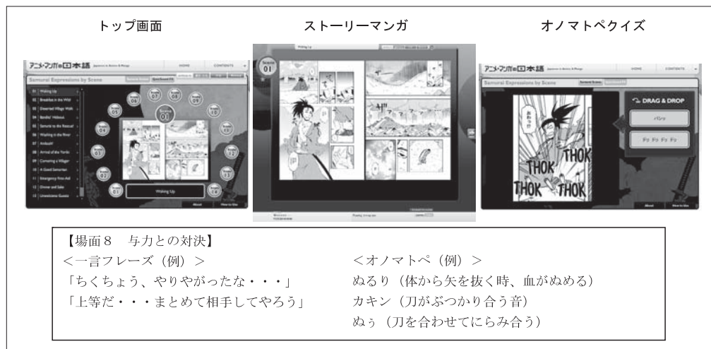
図3 「Samurai Expressions by Scene」