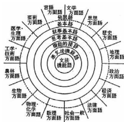
図3 林(1982)による語彙の分類

林(1982)は、日本人の頭の中の語彙を(1)文法機能語(助詞、接続詞、助動詞、感動詞)、(2)準文法機能語(形式名詞、5つの動詞)、(3)機能的接辞(接頭語、接尾語)、(4)思考基本語(概念を表す名詞、疑問詞、判断を表す動詞・形容詞・形容動詞・副詞など数百語)、(5)叙事基本語(生活場面で用いる語数千語)、(6)方面別基本語(例えば中学高校の教科書別に現れる基本語、メディアから雑然と入ってくる語数千語)、(7)方面別発展語(普通の人が生活するには知らなくても困らない専門用語)の7つのグループに分けているが、これらを級別にどこまでどうカバーすれば日本語学習者にとって十分な語彙表になるのか。日本語教育の世界に大きな影響力を持つ語彙表となるだけに、can do statementsなどを参考にしつつ、広く意見を集め、反映させていきたいと考えている。