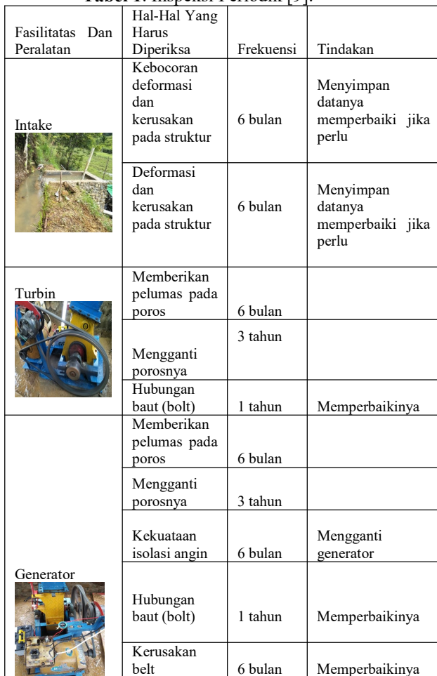
Tabel 1. Inspeksi Periodik [9].