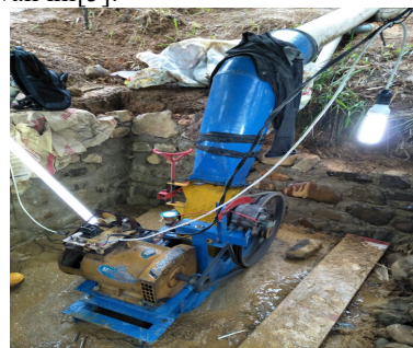
Gambar 2. PLTMH

Kita dapat mengoperasikan pembangkit tenaga mikrohidro ini dengan menggunakan manual pengoperasian dan perawatannya. Pada umumnya operator dari mikrohidro harus mengerti beberapa hal dibawah ini[5]: