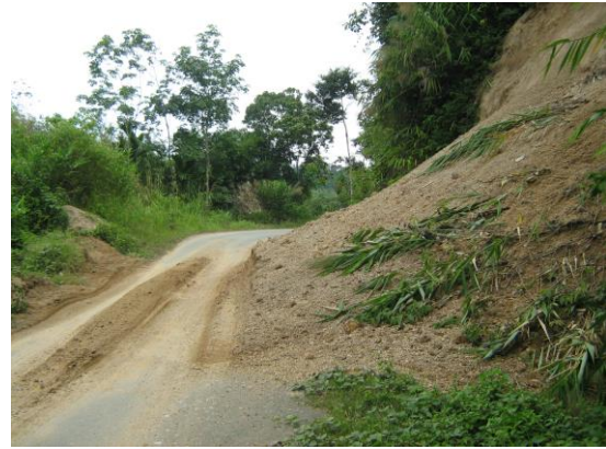
Gambar 1. Pasir Sumpur Kudus yang Longsor

Jenis tanah pada daerah Sumpur Kudus adalah tanah yang terdiri campuran antara pasir dengan sedikit lempung yang mempunyai nilai ikatan antar butiran tanah ( kohesi ) mendekati nol dan berat jenis yang rendah. Dengan jenis tanah seperti ini, aliran air pada lereng perbukitan yang terbuka, dapat dengan mudah menggerus permukaan lereng, sehingga pada akhirnya tanah yang terbawa air tersebut dapat menutup saluran air dan badan jalan yang ada, seperti terlihat pada gambar berikut.