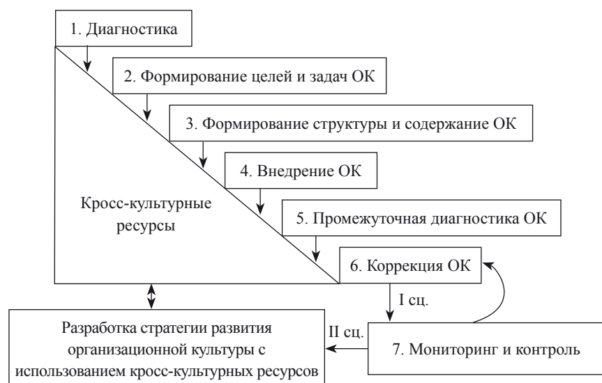
Рис. 4. Алгоритм формирования и развития организационной культуры с использованием кросс-культурных ресурсов международными предпринимательскими структурами

3-й этап. Формирование содержания организационной культуры предпринимательской структуры.