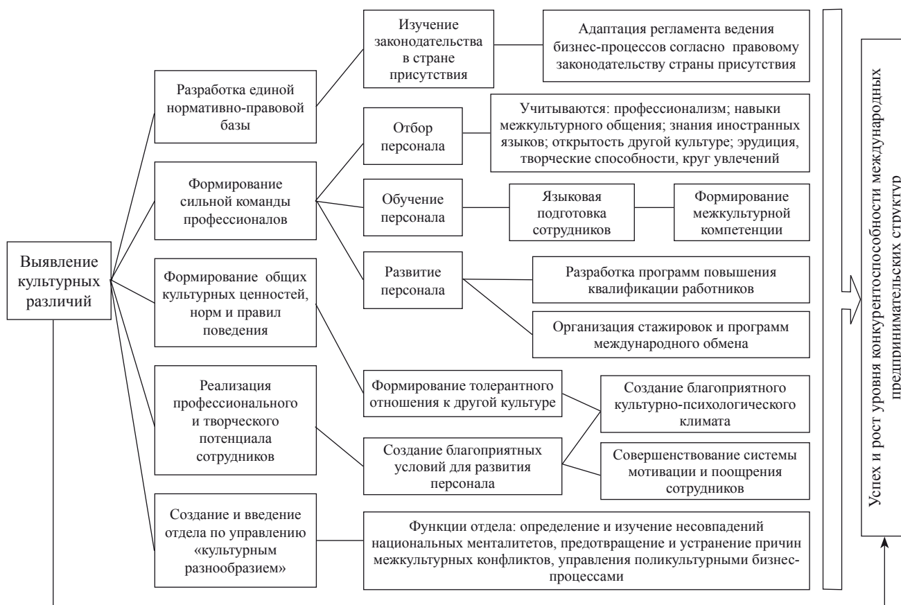
Рис. 6. Структурная модель трансформации кросс-культурных ресурсов организационной культуры в конкурентные преимущества международных предпринимательских структур

1. Разработка единой нормативно-правовой базы подразумевает изучение нормативно-правовой базы в стране присутствия и адаптацию к ним регламента ведения бизнес-процессов, документооборота, порядка создания, оформления и подписания