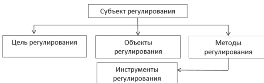
Рис. 1. Структура хозяйственного механизма отдельного субъекта

Е.С. Андрущенко относит механизм управления к более узкой категории, отмечая, что управление отражает в основном причинно-следственные связи и зависимости, возникающие в процессе коллективного труда и занимает подчиненное место по отношению к организационным формам производства. Например, организационно-правовые формы предприятий – акционер-