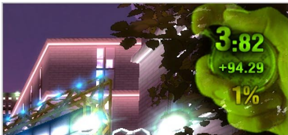
Gambar 2.5. Timer pada mode "Time Trial"

menghendaki kecepatan dan ketepatan waktu. Saat pertandingan ini dilakukan, akan muncul sebuah 'timer' pada pojok kanan atas layar. Timer tersebut disajikan dalam bentuk atau model digital, bukan dalam bentuk analog yang memungkinkan untuk melihat waktu kini, dan rentang waktunya. Dalam jam digital hanya waktu kini yang ditampilkan, rentang waktu kurang ditekankan atau justru dihilangkan. Yang ditekankan adalah waktu kini. Sehingga disini dapat dilihat, terjadi magnifikasi dimensi waktu, dan sekaligus reduksi tentang waktu. Pada pertandingan ini disediakan waktu kurang lebih 100 detik untuk mencapai garis finish. Pada urutan pertama merupakan waktu yang telah terbangun atau telah terlewati, pada gambar 2.4 angka menunjukkan 3 detik. Pada urutan kedua, adalah waktu yang tersisa, masih ada 94 detik lagi, dan berikutnya, urutan ketiga adalah indikator bahwa user masih menempuh 1% perjalanan menuju garis finish. Disini waktu sekarang dan detik yang tersisa menjadi penting, user akan berusaha secepat mungkin mencapai garis finish, jatah waktu 100 detik menjadi tidak penting lagi, ia menarik diri ke belakang, begitu juga dengan rentang waktu yang menjadi tidak penting, siklus waktu yang terjadi pada game tersebut menjadi lebih tidak penting, lebih-lebih siklus waktu yang aktual, atau bahkan sudah dilupakan. Disini user mengalami proses mental terhadap waktu, sehingga mengalami perubahan persepsi waktu beberapa lapis.