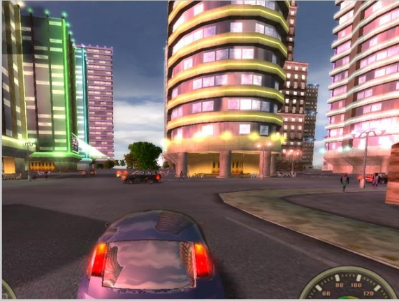
Gambar 2.2. Lingkungan virtual game City Racing, sebuah 'peniruan' alam melalui teknologi digital.