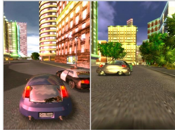
Gambar 2.6. Point Of View (POV), sudut pandang orang ketiga (kiri), dan sudut pandang orang pertama (kanan).