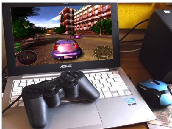
Gambar 2.3. Game City Racing sebagai teknologi simulasi.

fantasi menjadi tampak nyata. Kota yang ada di dalam game tersebut tidak dapat diverifikasi, atau dipahami sebagai kota yang benar-benar ada di pelosok dunia ini, berikut obyek-obyek yang ada didalamnya, oleh karena ia adalah realitas yang artificial, yang dikonstruksi oleh teknologi digital dan bersifat virtual.