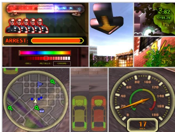
Gambar 2.7. Indeks yang harus ditafsirkan oleh user untuk mempersepsi, dan menyadari keberadaannya.

Yang keenam adalah indeks yang menunjukkan posisi atau urutan mobil yang dikendalikan user dalam sebuah pertandingan balap, serta berapa persen jalan yang telah ditempuh oleh user dari garis start hingga finish. Indeks ini disajikan dalam bentuk angka yang jika ditafsirkan akan membantu untuk mengetahui posisi user, serta membantu untuk menentukan keputusan yang harus dilakukan oleh user, misalnya lebih mempercepat laju mobil, lebih berkonsentrasi dalam mengendalikan mobil untuk menghindari kecelakaan, atau bahkan membatalkan pertandingan pada saat masih berlangsung karena dirasa sudah tidak mungkin untuk memenangkannya.