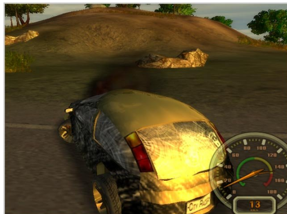
Gambar 2.1. Mobil rusak, salah satu perubahan, atau modifikasi yang dilakukan oleh user terhadap lingkungan virtual.