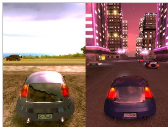
Gambar 2.4. Siang, dan malam hari yang terjadi pada game City Racing.

Menurut Heidegger, waktu bersifat eksistensial karena waktu dilihat dalam kaitannya dengan apa yang dialami manusia dalam dunia. Manusia terbatas oleh waktu dan ini merupakan temporalitas manusia. Adapun dalam dunia virtual terdapat durasi, namun ia tidak terikat oleh waktu yang dialami oleh manusia, dengan kata lain, game City Racing memiliki temporalitasnya sendiri. Dalam game ini, siklus waktu lebih cepat, yakni 1:24, waktu 24 jam seperti yang ada pada dunia nyata, ditempuh dalam waktu satu jam. Disini user mengalami perubahan persepsi waktu. Pertandingan balap dilakukan pada saat malam hari (dalam game ini), user harus mendatangi tempat yang sudah ditandai pada map untuk kemudian berpartisipasi dalam pertandingan balap. Berdasarkan pengamatan yang telah dilakukan, user memainkan game ini pada waktu siang hari tepat pada pukul 12.00, dan pada game tersebut sudah tiba waktu malam, dan user mengatakan “wah, sudah malam, waktunya balapan ini!”. Ada sebuah tujuan pada waktu malam hari, yakni mengikuti pertandingan balap, user berputar-putar di jalanan kota untuk “membuang waktu” menunggu datangnya malam.