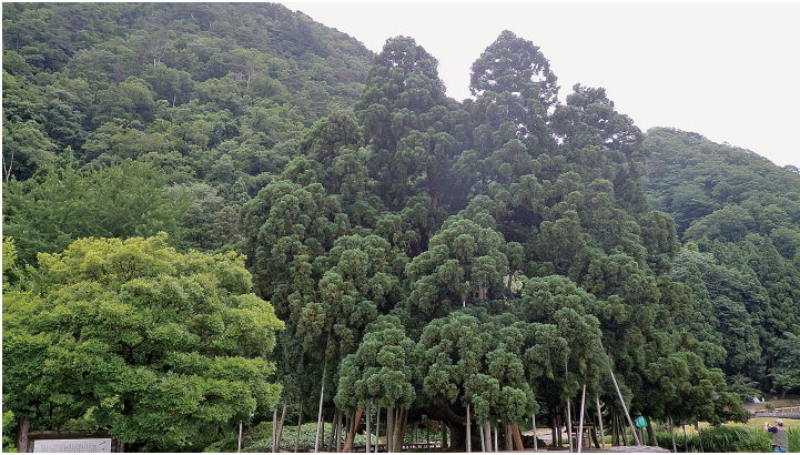
写真3 a. 石川県の御仏供杉全景 (2012年7月撮影)