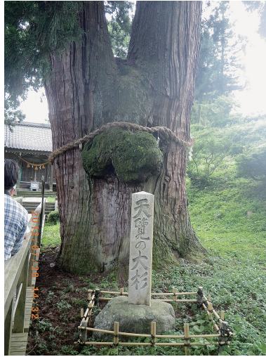
写真1. 石川県の栢野大杉 (2012年7月撮影)