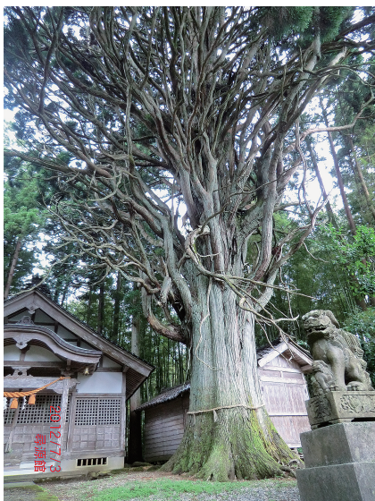
写真6. 石川県新宮神社のスギ (2012年7月撮影)