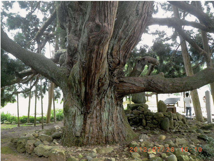
写真3 b. 御仏供杉幹 (2012年7月撮影)