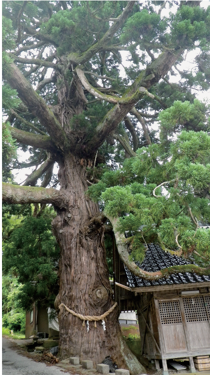
写真4. 石川県の地蔵杉 (2012年7月撮影)