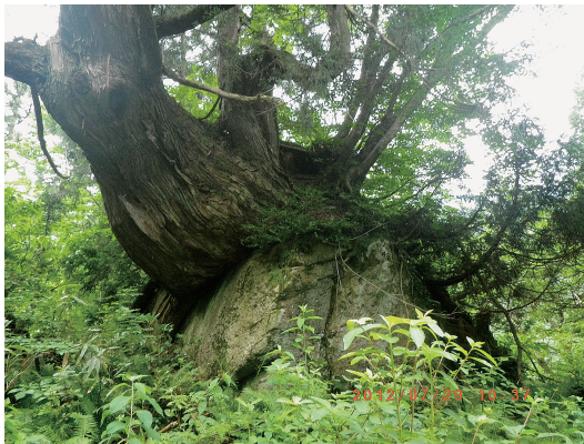
写真5. 富山県の洞杉 (2012年7月撮影)