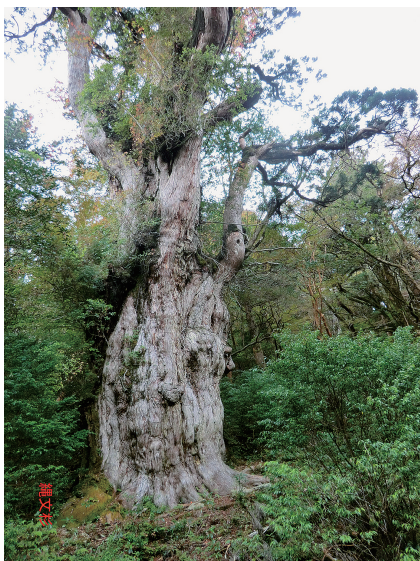
写真7. 鹿児島県の縄文杉 (2012年2月撮影)