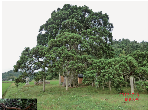
写真2 a. 石川県の倒さスギ