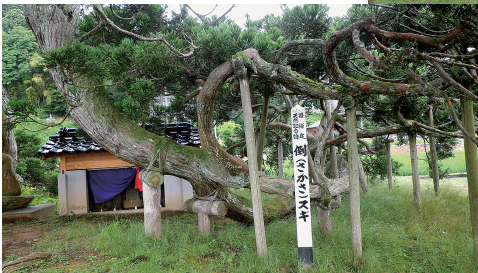
写真2 b. 倒さスギの内側 (2012年7月撮影)