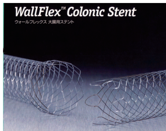
図1 ステントの種類 Wall Flex™ Colonic Stent (BOSTON SCIENTIFIC 社) ステント径：22mm，25mm ステント長：6 cm，9 cm，12cm

2012年5月から2013年5月までに悪性腫瘍に伴う大腸狭窄に対しステントを留置した13例（以下，S群）と、2011年4月から2013年5月までに経肛門的イレウス管を留置した14例（以下，I群）に対して年齢，性別，腫瘍の局在および進行度，留置後状況および期間，合併症について比較検討した。